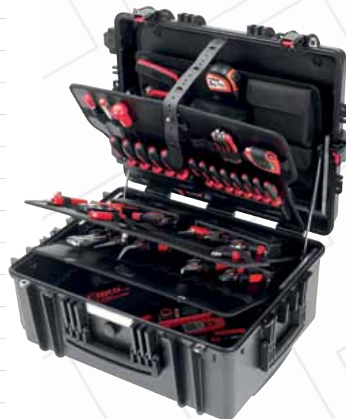
CIMCO-Artikelnr. 17 6882