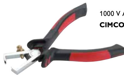
1000 V Abisolierzange CIMCO-Artikelnr. 10 0686