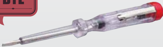
Phasenprüfer, CIMCO-Artikelnr. 11 1280

Diese Methode ist nicht nur sehr unsicher (da der Phasenprüfer unter suboptimalen Umständen nicht einwandfrei funktioniert), sondern zudem auch bei unzulässig hohen Spannungen mit einem großen Risiko behaftet. Aus diesen Gründen stellt