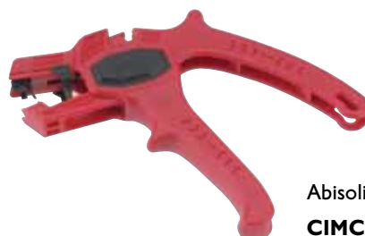
Abisolierzange Super 4 PLUS CIMCO-Artikelnr. 10 0780