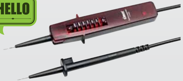
Spannungsprüfer, CIMCO-Artikelnr. 11 1442

Die mechanische Abisolierzange ist ein klassisches Werkzeug, mit welchem der Auszubildende lernt, wie unterschiedlich die marktüblichen Leitungen sind und wie präzise beim Abisolieren vorgegangen werden muss, um z. B. Beschädigungen oder Einkerbungen des Leiters zu vermeiden. Ein Maximum an Sorgfalt und Sachkenntnis ist das Ergebnis der Arbeit mit der klassischen Zange.