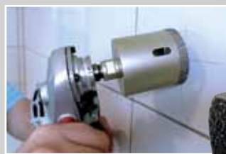
Zur Zentrierung ohne großen Druck arbeiten und auf einer Kante anbohren